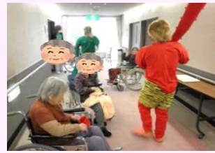
2月 当施設節分にて