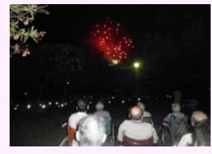
8月 茅ヶ崎花火大会にて