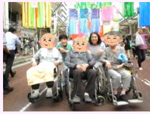
7月 平塚七夕祭りにて