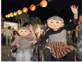
8月 当施設納涼祭にて