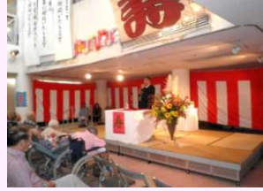
9月 当施設敬老会にて