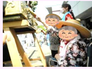
7月 浜降祭神輿来園にて