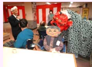
1月 当施設新年会にて