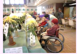
11月 菊花展見学にて