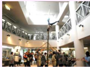
1月 消防団まとい来園にて