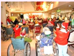
12月 当施設クリスマス会にて