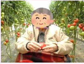
4月 トマト狩りにて