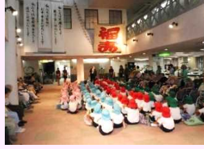
9月 幼稚園児慰問にて